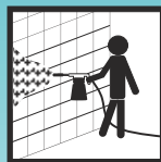
Verarbeitung mittels Schaumkanone