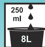
Unterhaltsreinigung: Verdünnung von 1:32