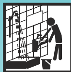
Manuelle Verarbeitung im Schwimmbad- und Sanitärbereich

Die hierin enthaltenen Informationen und Empfehlungen entsprechen zum Zeitpunkt der Veröffentlichung unserem besten Wissen und Kenntnisstand. Es liegt in der Verantwortung des Benutzers, sicherzustellen, dass das Produkt für die beabsichtigte Anwendung geeignet ist.