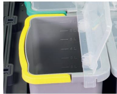
Hygienischer, transparenter Deckel zum Aufstellen. Eimer mit Skalenangabe.