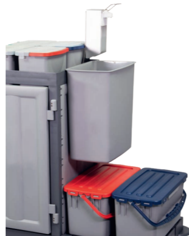
Einhänge-Eimer 30 Liter. Art.-Nr. 305.035