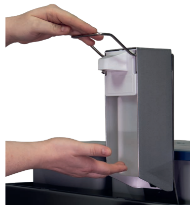
Desinfektionsmittelpender für 500 ml Flaschen. Art.-Nr. 301.289