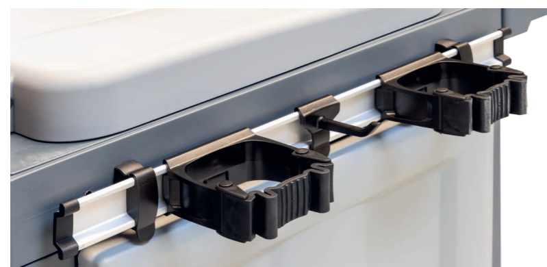
Multifunktionale Toolhalterung serienmäßig. Art.-Nr. 305.043