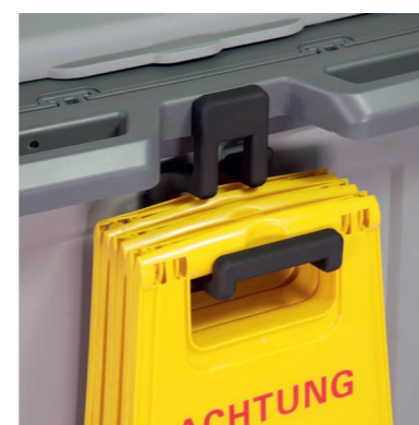
Praktische Warnschildhalterung für bis zu drei Warnschilder.