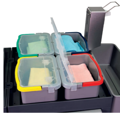
Durchgängige 4-Farbcodierung. Optimaler Halt durch abgesenkte Eimer.