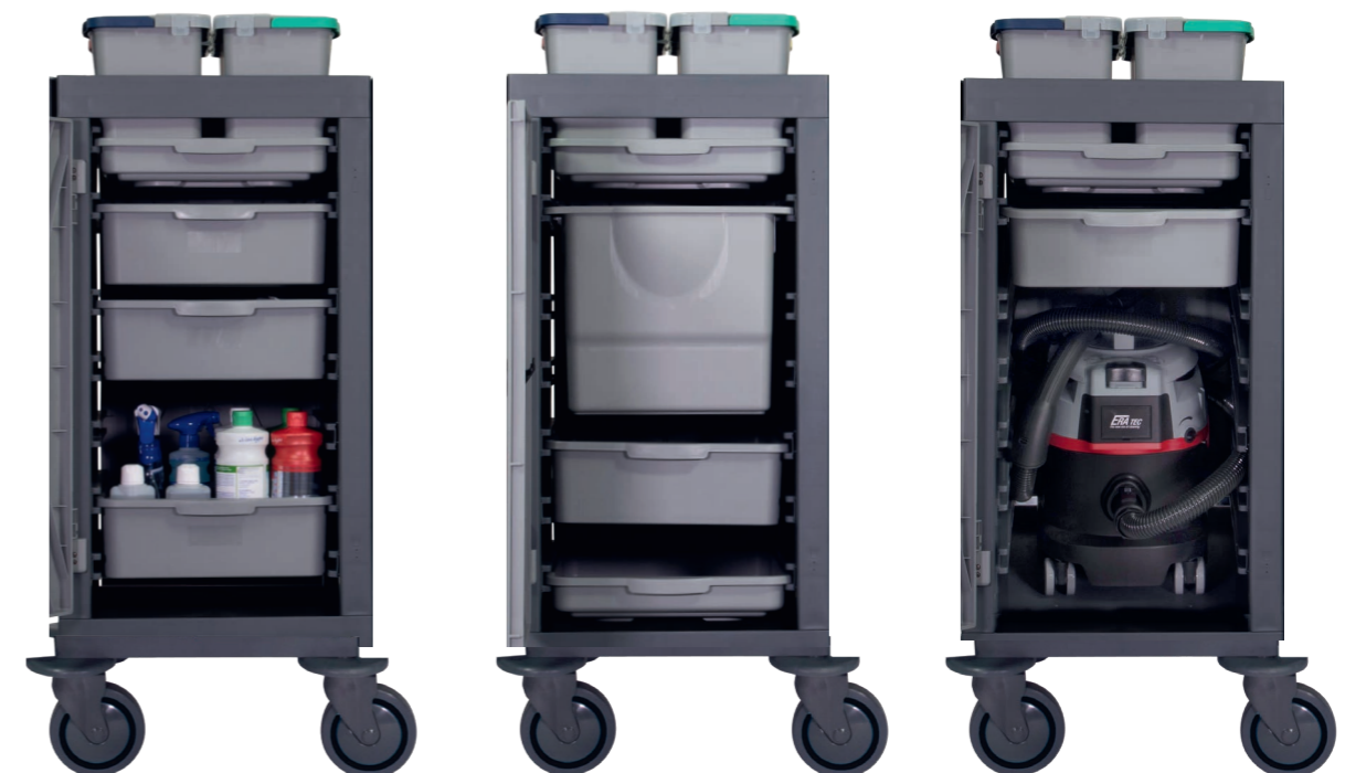
Schubladen Serienausstattung (ohne Zubehör).

Hohes Ladevolumen und variable Einteilung.