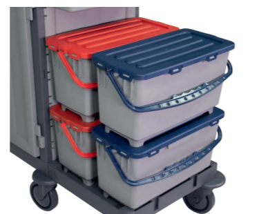
Transport von bis zu vier Mopp-Boxen.