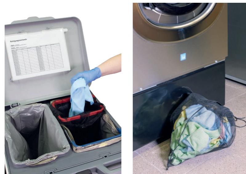
Das 35 Liter große und herausnehmbare Wäschenetz eignet sich hervorragend für die Entsorgung bereits verwendeter Reinigungstücher. Die praktische Ablage für Reinigungspläne befindet sich direkt im Blickfeld.