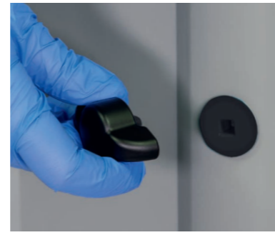
Schutz vor unbefugtem Zugriff über abziehbare Schlüsselstecker.