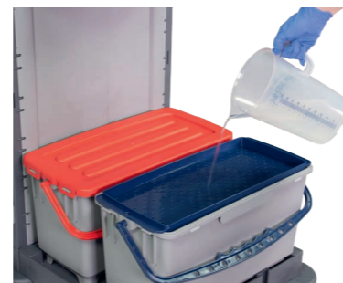
Optionale Tränkhilfe. Art.-Nr. 305.032 blau & 305.033 rot