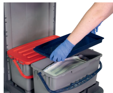
Fassungsvermögen von 10 Stk. Wischbezüge in 40 cm je Box.