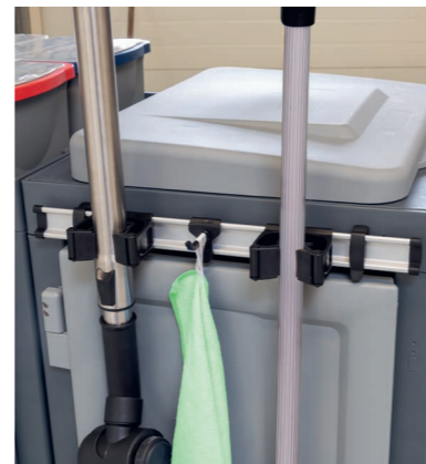
Zwei weitere Toolhalter können nachgerüstet werden. Art.-Nr. 305.043