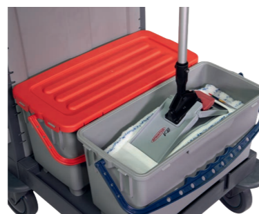
Berührungsfreie Aufnahme durch optionalen V-Wing Klapphalter (S. 116).