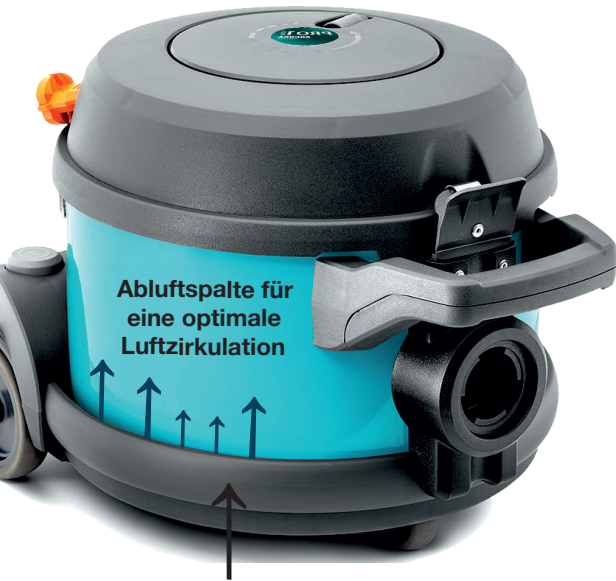
Wand- und Möbelschutzleiste aus Gummi